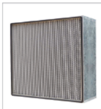
有隔板高效空气过滤器