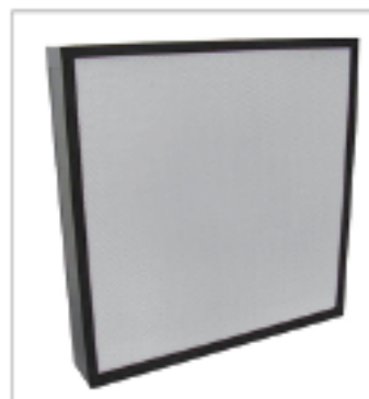
无隔板高效空气过滤器